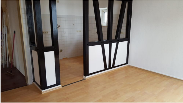
Küche 1. OG